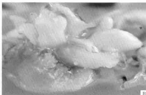
B. 花瓣上诱导形成的瓣状体 Formation of petal-like structures on the petal explants