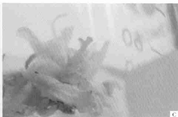
C. 瓣状体中形成的黄色花柱-柱头状物 The yellow style stigma-like structure formed on the petal-like structures group