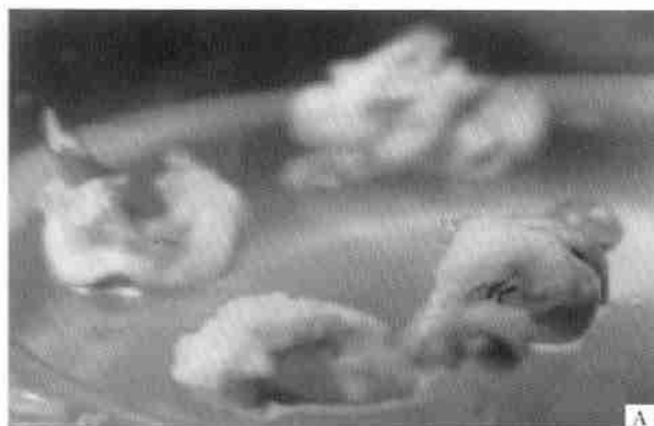
A. 培养 5~6 周后花瓣膨大黄绿色的基部 The petals of C. sativus after 5-6 weeks in culture