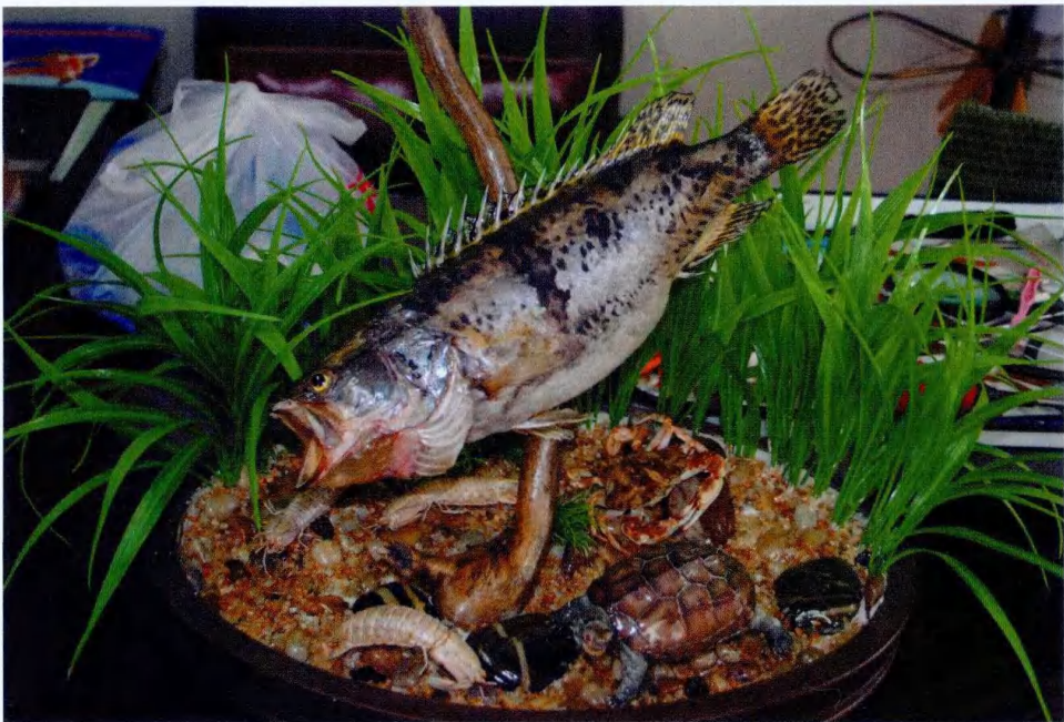
图3 新方法制作的鱼类标本

2.7 安装义眼和整理姿态 先装义眼,装义眼时先在眼眶中填入一定量的粘土,然后放上义眼,用竹签进行整形。胶泥或粘土有一定的粘性,可固定义眼,不需要再加黏胶固定义眼,这样有利于眼部整形。义眼装好后根据形态要求处理头部,如果需要口和鳃盖张开则用珍珠棉塞入口中,形成需要的姿态,标本干后取出珍珠棉;口和鳃盖闭合则用线把鳃盖膜和身体连接部位缝上几针,标本干后拆除缝合线即可。通过弯曲鱼体实现不同姿态的需求,在弯曲时要小心,防止支架穿破鱼体。用普通发卡夹住鱼鳍,可使鱼鳍平整,并使鱼鳍达到不同的展开程度,使形态更加自然,待标本完全干后取下发卡。鱼鳍有小的破损时,可用无色玻璃胶进行修补。根据不同的姿态要求,用手把鱼鳍展开到需要的程度,然后用发卡夹住固定。用发卡夹住鱼鳍时,可在鱼鳍两侧放置薄塑料片,这样可以使鱼鳍平整,并保证鱼鳍完好。胸鳍与腹鳍一般与鱼体呈 30^{\circ} \sim 45^{\circ} 的角度,背鳍、臀鳍