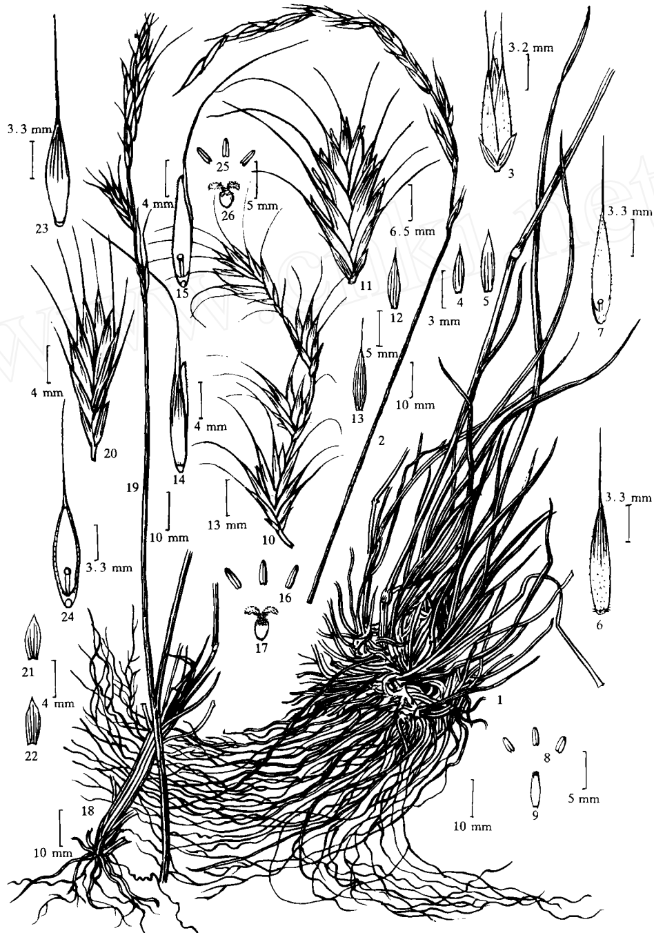
图1 1~9. 红原鹅观草;10~17. 守良鹅观草;18~26. 大柄鹅观草。1,18. 植株下部;2,19. 花序;3,11,20. 小穗;4,12,21. 第一颖片;5,13,22. 第二颖片;6,14,23. 第一小花背面;7,15,24. 第一小花腹面;8,16,25. 花药;9. 颖果;10. 花序的一段;17,26. 雌蕊。(王颖绘)

Fig.1 1~9. Roegneria hongyuanensis ; 10~17. R. shouliangiae ; 18~26. R. magnipoda . 1, 18. basal part of plant; 2, 19. spike; 3, 11, 20. spikelet; 4, 12, 21. first glume; 5, 13, 22. second glume; 6, 14, 23. dorsal view of the first floret; 7, 15, 24. ventral view of the first floret; 8, 16, 25. anthers; 9. caryopsis; 10. a part of spike; 17, 26. pistil.